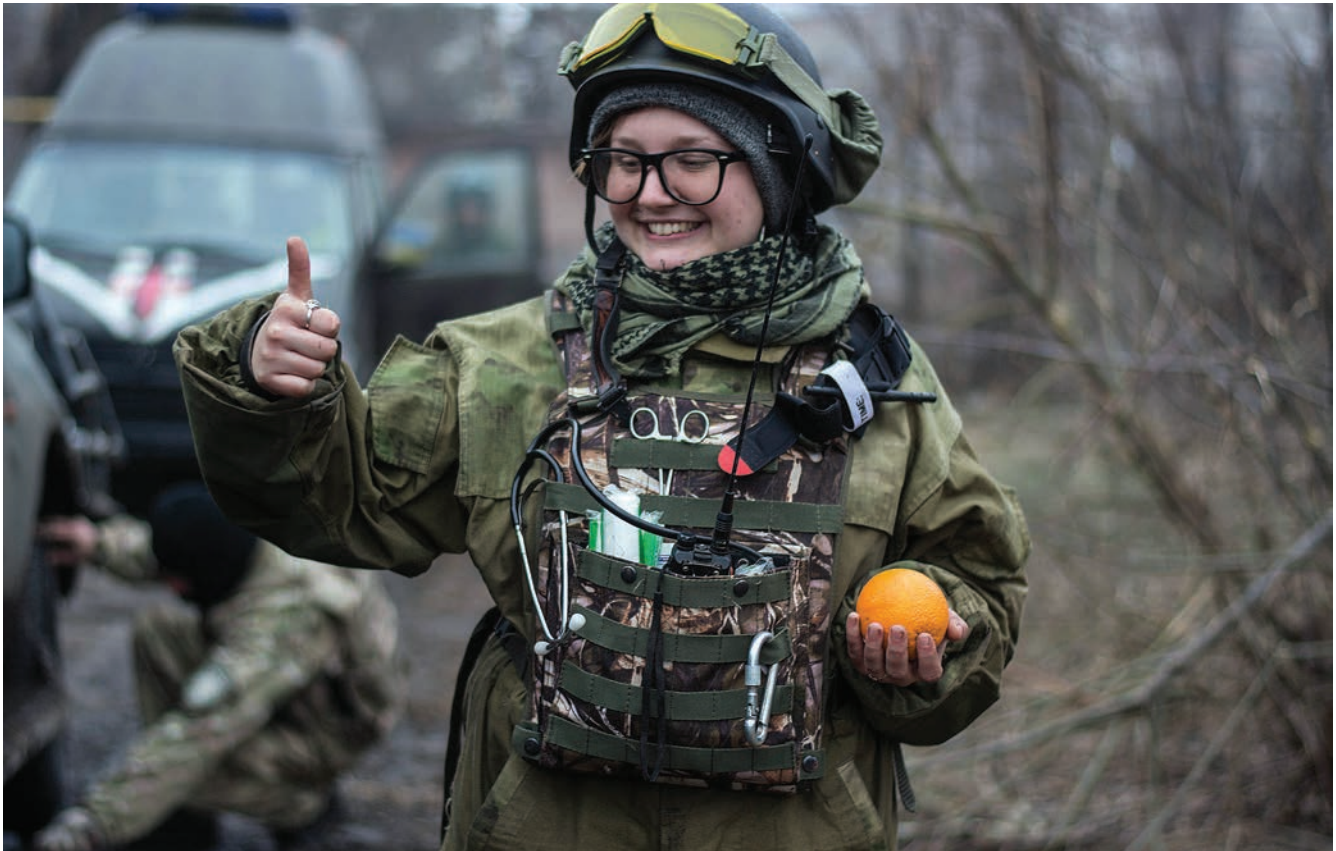
«Зоя» (позивний), парамедик та санінструкторка медичного підрозділу «Госпітал'єри». За освітою культуролог. Перш ніж піти на фронт, працювала в «Пінчук Арт Центр» в Києві.

«Якщо жінка не подає скаргу та не дає свідчення, то, на жаль, ми мало що можемо зробити».