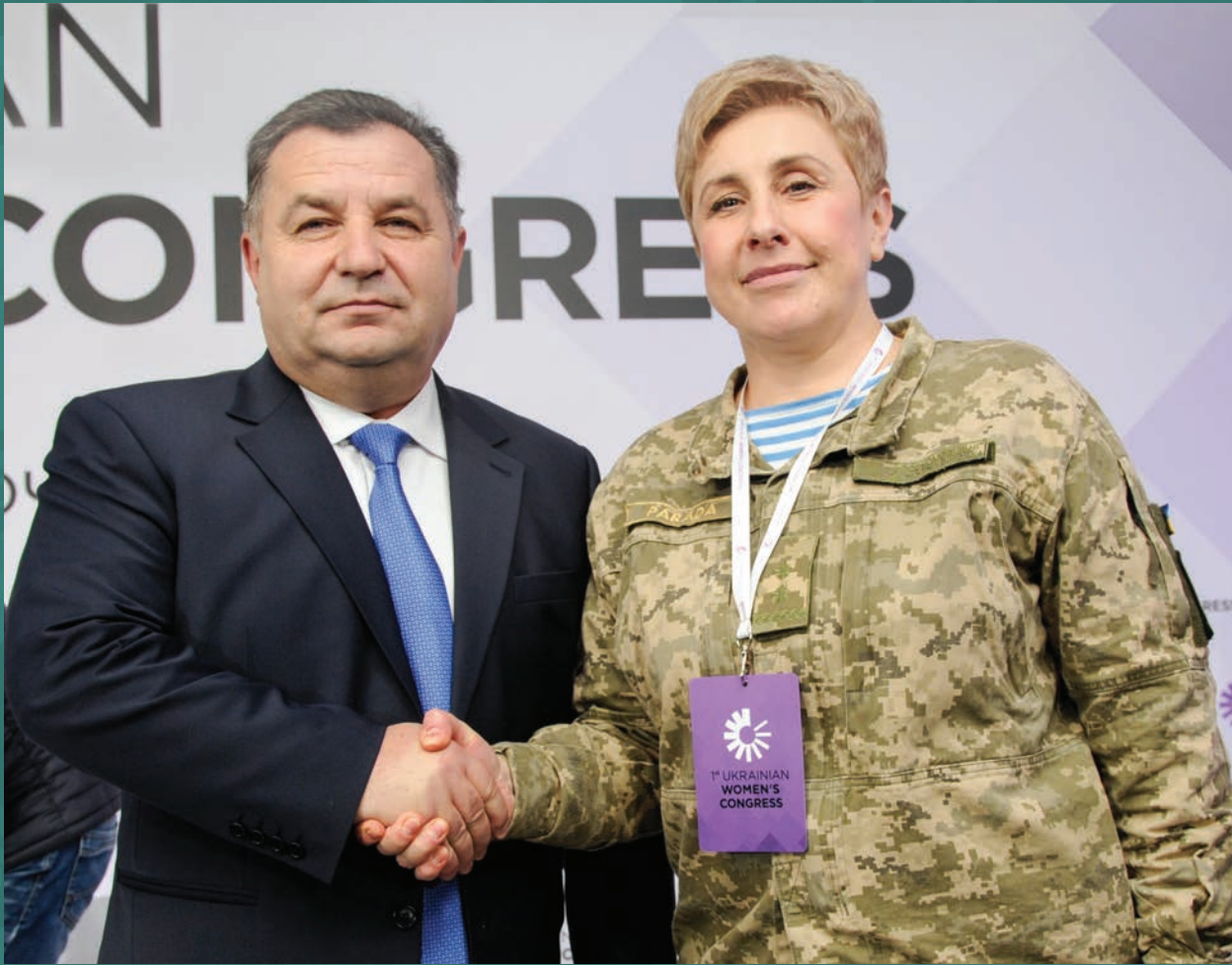
Перша жінка-миротворець в Україні, підполковниця, Третя Секретарка Оборонної Секції Місії України при НАТО Валерія Парада отримала звання полковника від Міністра Оборони України Степана Полторака під час свого виступу на Першому Жіночому Конгресі, 22 листопада 2017р.

секторі повинні подавати звіти на розгляд Офісу Віце-прем'єр-міністра з питань євроатлантичної інтеграції, який згодом може скласти узагальнений звіт для подальшого розгляду до Верховної Ради та решти Кабінету Міністрів.