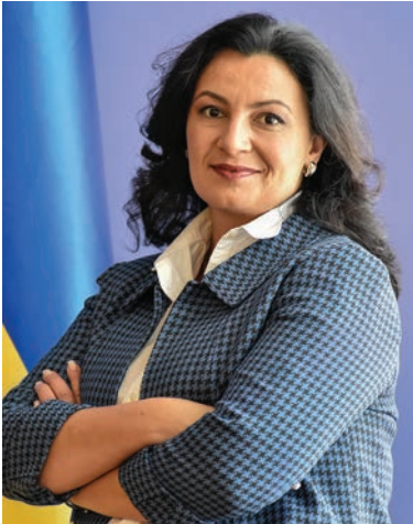
Фото Віце-прем'єрки Іванни Климпуш-Цинцадзе