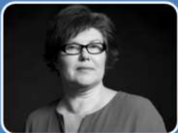
Урядова уповноважена з питань ґендерної політики КАТЕРИНА ЛЕВЧЕНКО