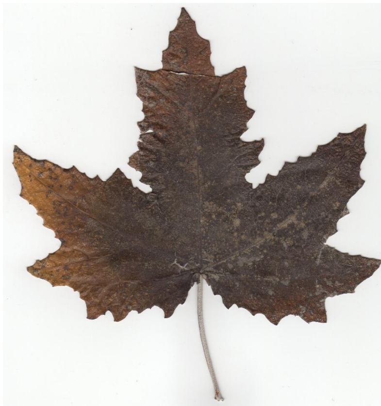
Фото 3 – Листя з дерева території НПЗ (майданчик №3)