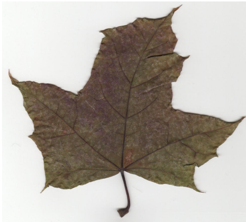
Фото 2 – Листя з дерева вул. Рішельєвської (майданчик №2)