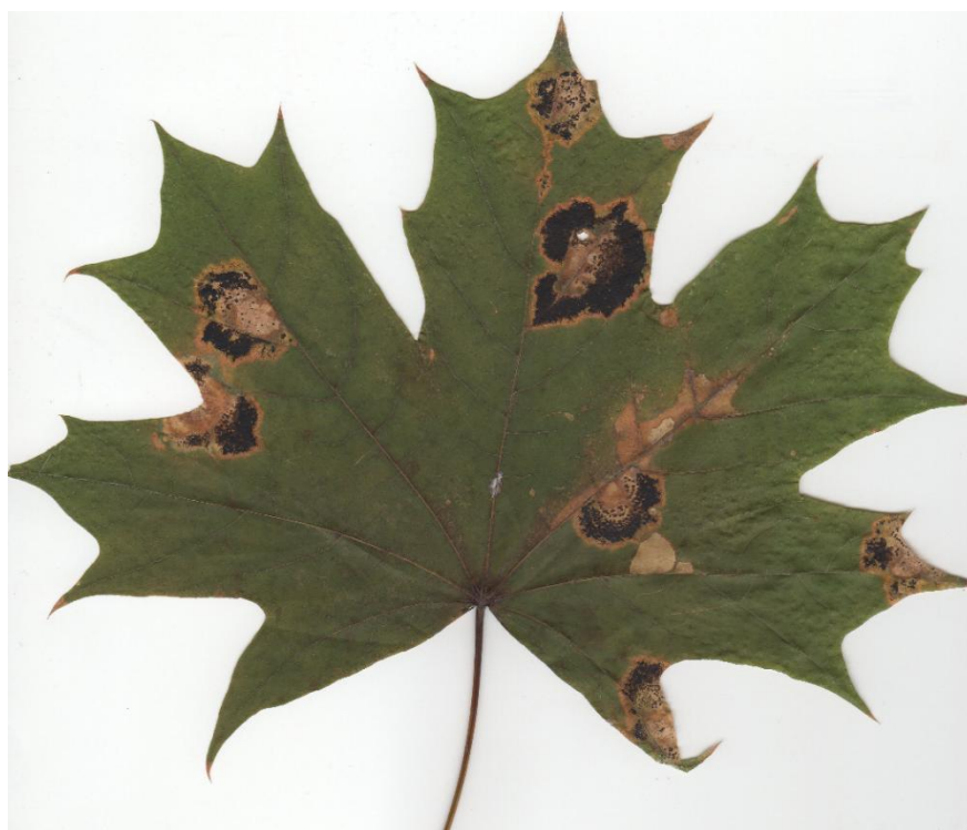
Фото 4 – Листя з дерева парку ім. Т.Г. Шевченка (майданчик №1)