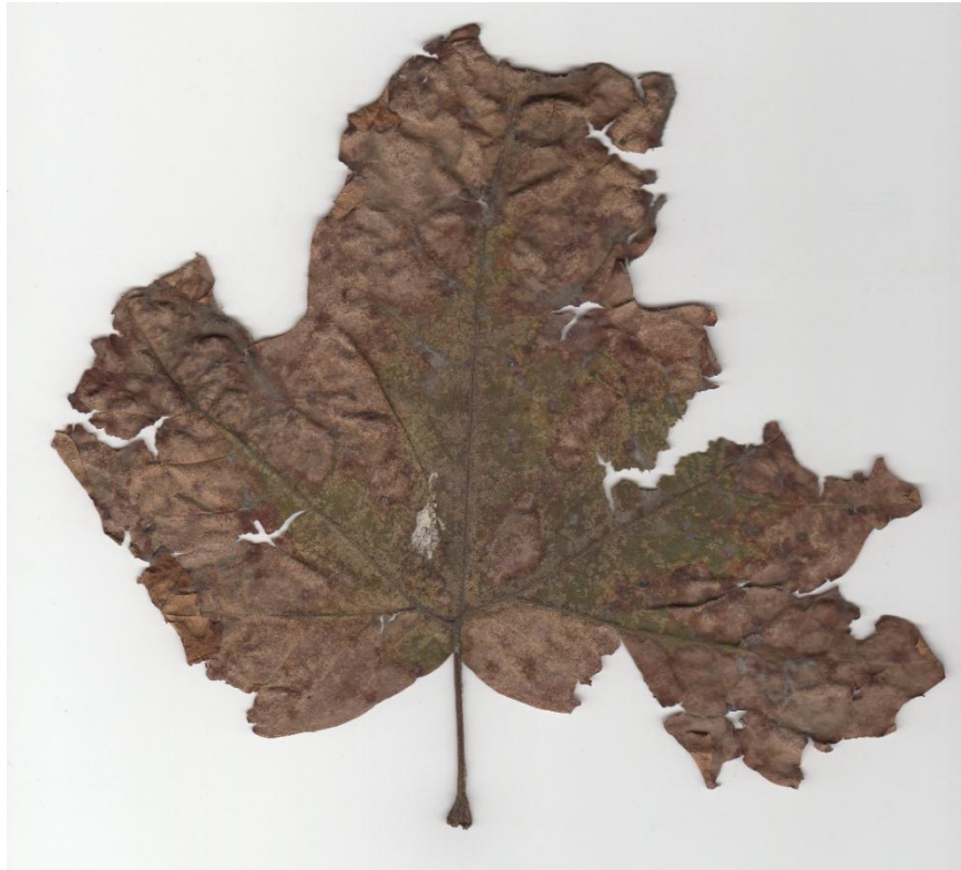
Фото 1 – Листя з дерева вул. Рішельєвської (майданчик №3)