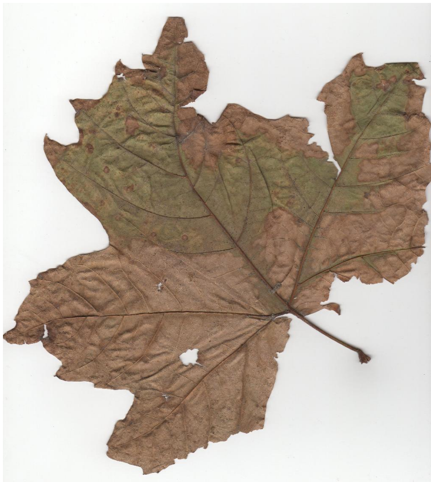
Фото 5 – Листя з дерева парка ім. Т.Г. Шевченка (майданчик №1, зігнутість верхівки праворуч)